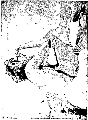
नावंत वयून शरयू नदी ओलाटताना